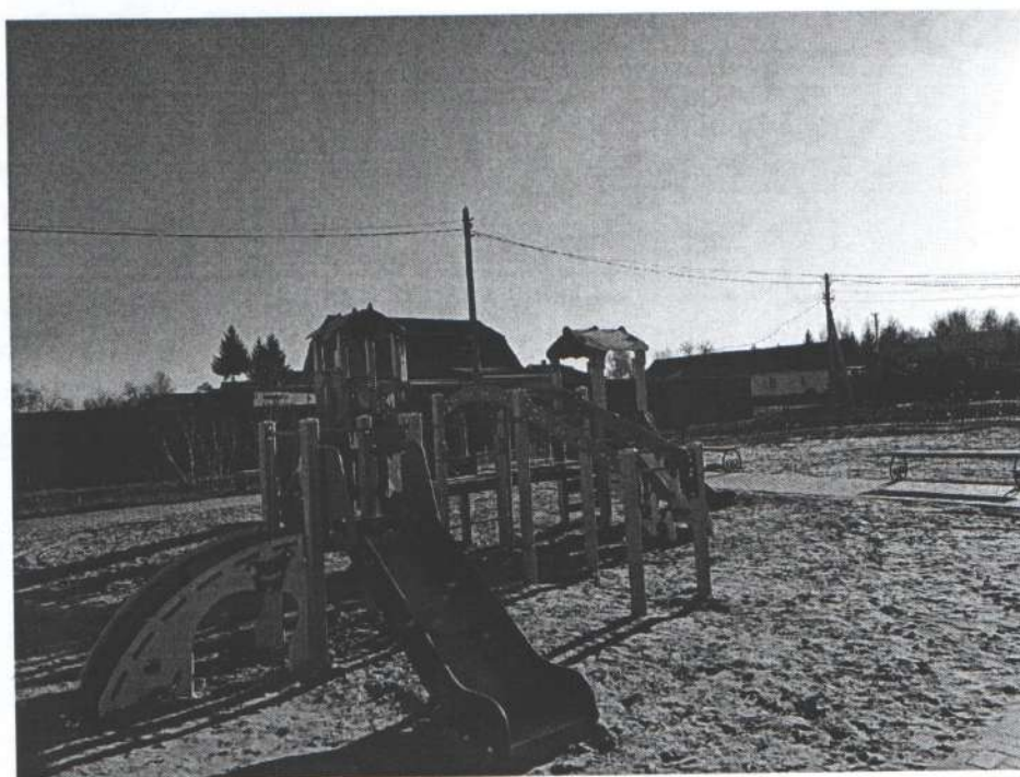
Фото: площадка для игр